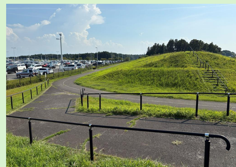
百里飛行場 新交流拠点整備予定地の現況

スポーツやイベント等、様々な市民の活動や交流を支援するとともに、空港利用者、基地利用者、自衛隊員など、多様な人々を迎え入れ、知り合い、交流し、憩う施設として計画しています。