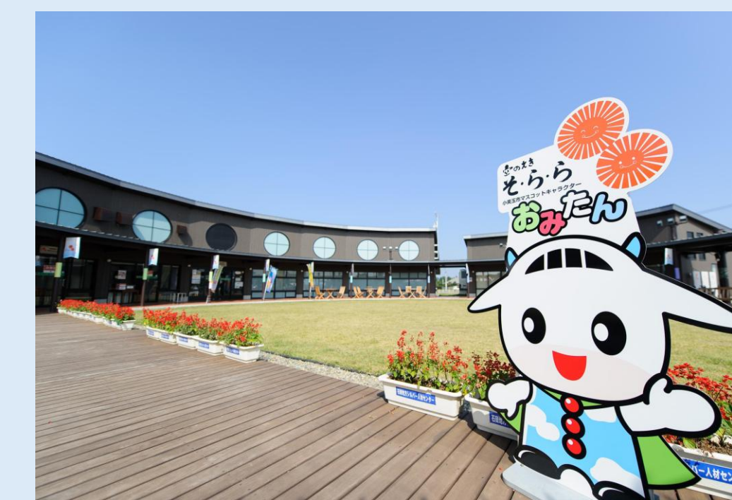
空のえき「そ・ら・ら」の現況

小美玉市の産業振興、観光の重要な資源である航空自衛隊里基地・茨城空港の立地を活かし、市民が将来にわたって愛着をもって利用でき、広域から近隣まで様々な交流を促進する施設の整備を計画しています。