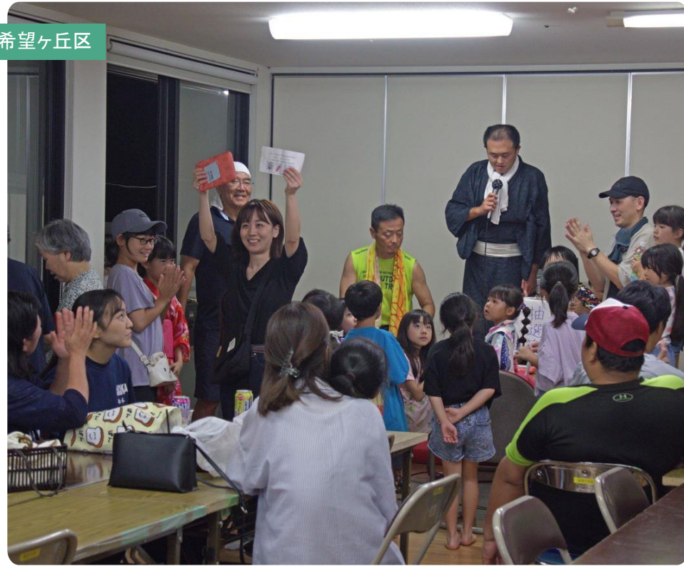
↑ 大抽選会でみんな大盛り上がり!