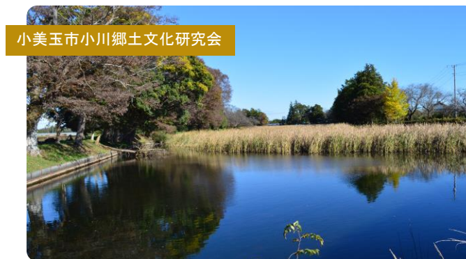
小美玉市小川郷土文化研究会