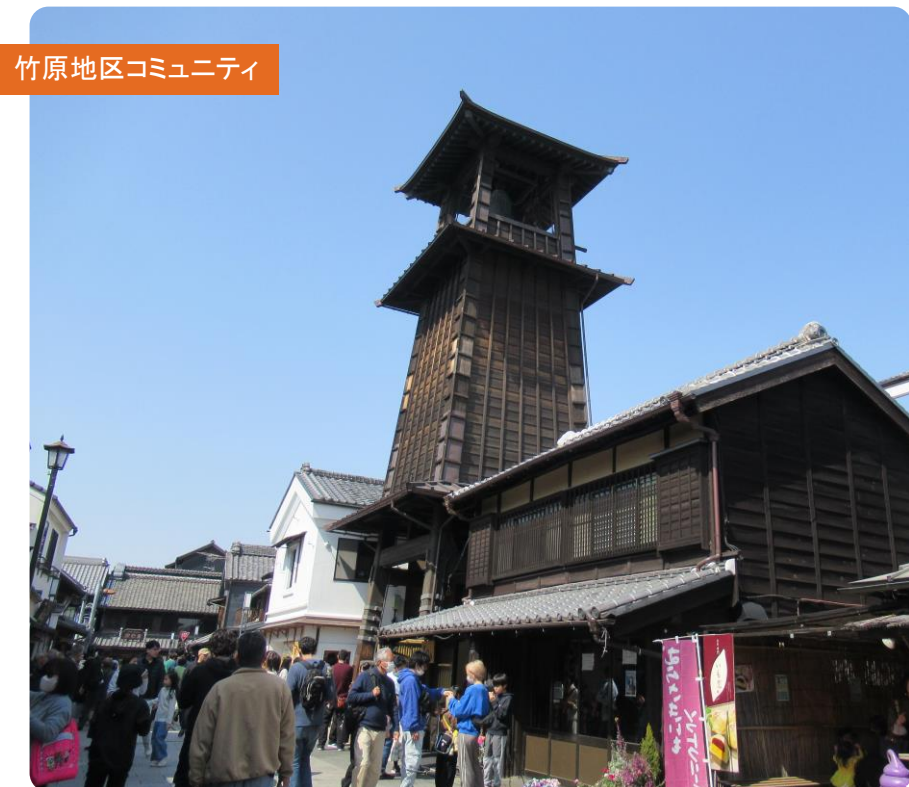
竹原地区コミュニティ