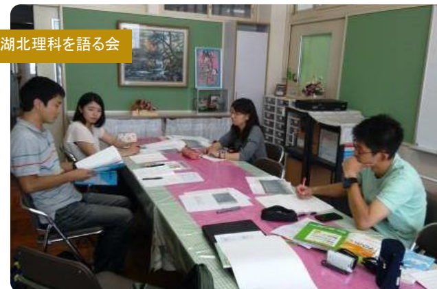
湖北理科を語る会の会議の様子