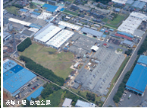
茨城工場 敷地全景