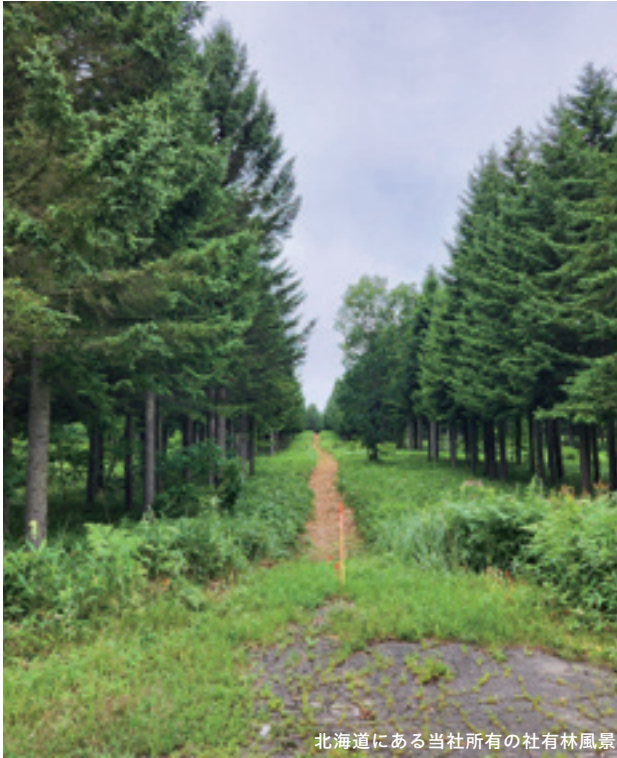
北海道にある当社所有の社有林風景