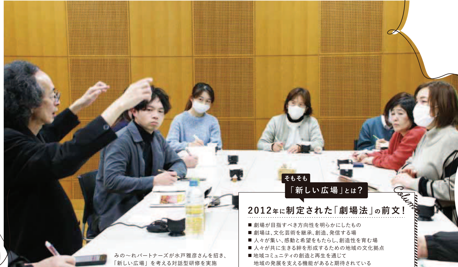
そもそも「新しい広場」とは?