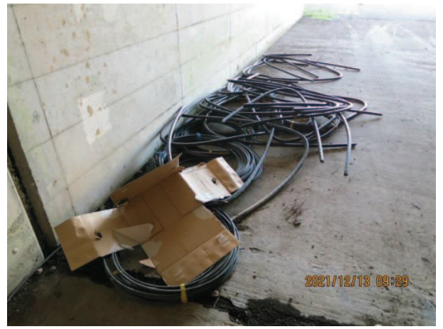
羽刈地内 高速隧道 ケーブル類