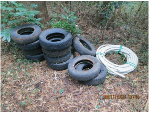
寺崎地内 タイヤ等 山林