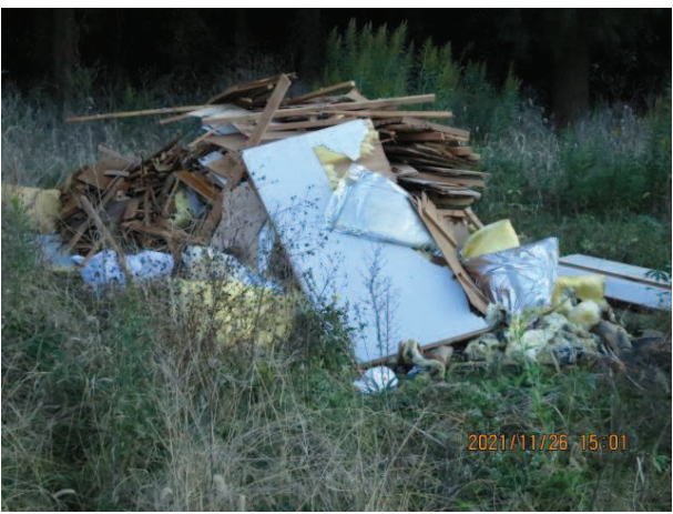
山野地内 解体ごみ 民地