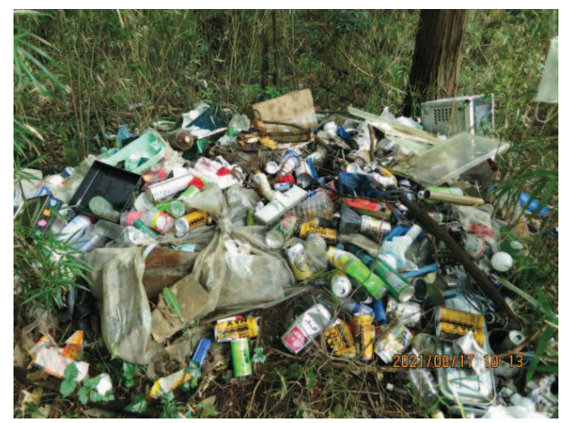
下吉影地内 生活ごみ 山林