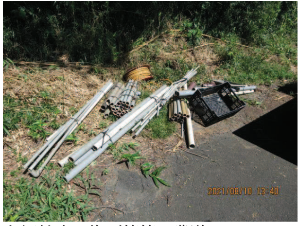
与沢地内 塩ビ管等 農道