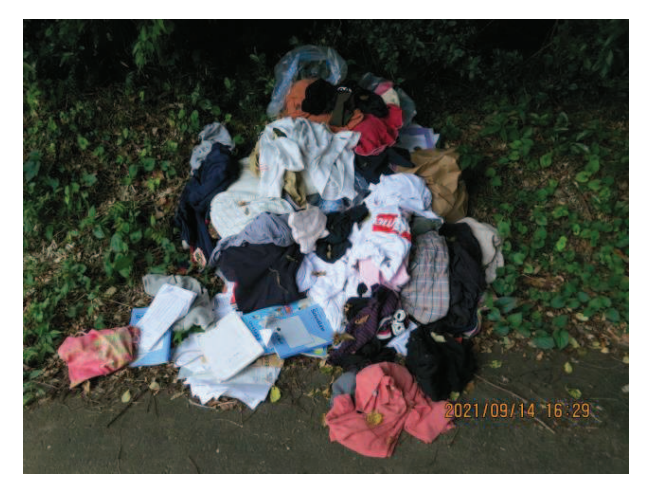
柴高地内 古着類 生活道路