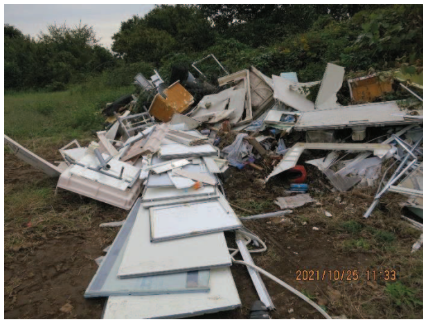
三箇地内 解体ごみ 三箇地内