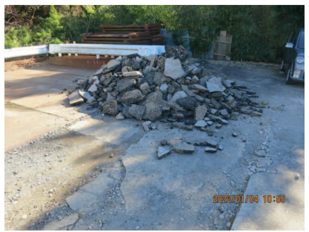
中野谷地内 ガラ 民地(幹線道路脇)