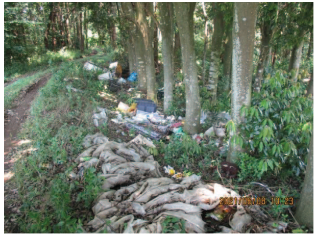
上合地内 片付けごみ 生活道