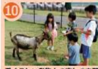
10 愛くるしい動物との癒しの空間 そらら ふれあい牧場

美味しい中華料理がめじろ押し。人気抜群、自慢のちゃしゅうを是非どうぞ。外はパリッパリ、中はとってもジューシーな「唐揚げ」や、小美玉市特産のニラがたっぷり入った「肉ニラ餃子」も自信作です。是非ご賞味あれ。