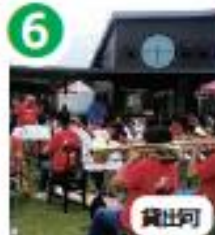
6 様々な催しで賑わう イベントひろば