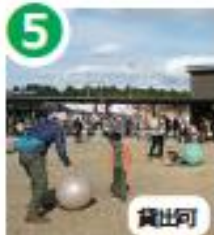
5 子どもの笑顔が溢れる 太陽のひろば

そららの心は「お客様は神様」です。神は「最高の商品」と「最高のマナー」です。手足は「テナントの営業努力」と「駅主催のイベント」です。無敵大を表す『双子の太陽ひろば』と、上昇する音符を表す「そらら」のように、いつも新しい取り組と熱い思いをお届けします。