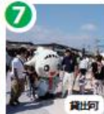
7 商店やフリマで賑わう マルシェひろば