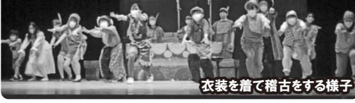
衣装を着て稽古をする様子

演劇Crew Cosmo's 「ピーターパン」 2021年8月21日(土) ①13:00~ ②16:00~ ◇入場無料(要整理券) ◇全席指定 お問い合わせ 0299-26-9111(コスモス)