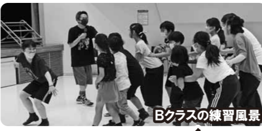
Bクラスの練習風景