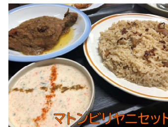
マトンビリヤニセット