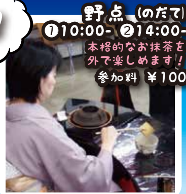
野点 (のたて) ①10:00- ②14:00- 本格的なお抹茶を 外で楽しめます! 参加料 ¥100