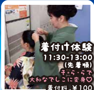
着付け体験 11:30-13:00 (先着順) そららで 大和なでしこに変身♡ 着付料 ¥100