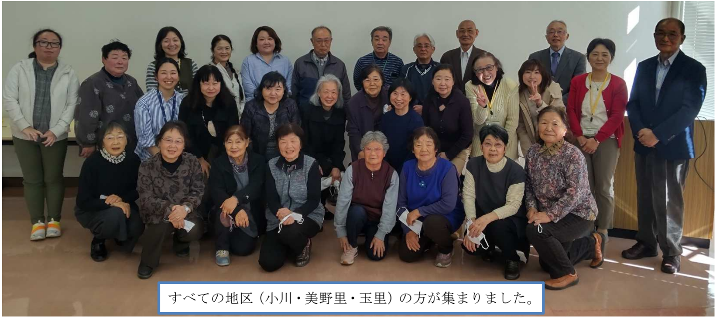
すべての地区（小川・美野里・玉里）の方が集まりました。

3月27日（水）に各学校等のコーディネーター、学習支援ボランティア参加者、活動に興味を持ってくださった方を迎え、情報交換会を実施しました。これまでの活動の振り返りや今後はどのように行っていったらよいかなどを情報共有しました。