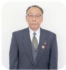
小美玉市公明党 (1名)