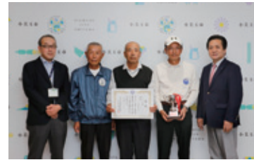
ゲートボール種目:おみたまクラブ