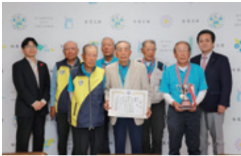
クロッキー種目:おみたまにじいろクラブ

第28回茨城県健康福祉祭いばらきねんりんスポーツ大会（開催地：笠松運動公園）のクロッキー、ワナゲ、ゲートボール種目で老人クラブなどの市内3団体が優勝しました。クロッキー種目は昨年に引き続きの優勝を果たし、連覇を成し遂げました。