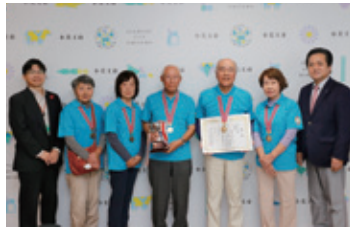
ワナゲ種目:北浦シニアクラブ