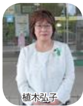
小美玉市公明党 (1名)

市民の負託に応えるため、地方行政等に関する諸制度、市政及び国・県政の動向等に関する広範かつ専門的な知識を得るため、これらに対する調査研究活動が必要となります。このため、議会においては、「委員会」活動とは別に、「会派」を中心に政策研究等の活動が行われることがあります。