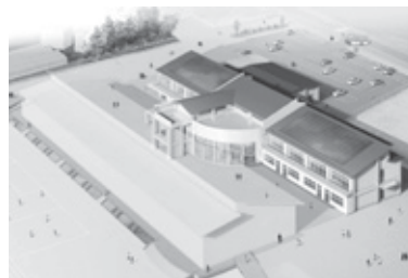
▲小川北義務教育学校完成予定図

Q 直近の今年度、今後2年から3年の計画を伺う。 A 総務部長 長期の整備費用、将来を見据えた段階的な再編の方向性を踏まえた今後40年間の長期的な計画として10年ごとの具体的な実行計画を示している。今年度の新設する施設として、来年度開校予定の小川北義務教育学校、小川北学区放課後子どもプラン、羽鳥地区の第3分団消防機庫、また竹原小学校体育館の改修工事を実施する。 解体は閉校した橘幼稚園、橘小学校、玉里小学校、玉里中学校、そして竹原小放課後子どもプランがある。来年度以降、今後2、3年の取組み予定について、具体的な実施時期は現在調整中。今後、計画の進行管理をしていく中で、財政状況等も踏まえつつ、施設ごとの対策の内容や実施時期に応じて市民の方々に対し、周知や説明を行い取り組んでいく。