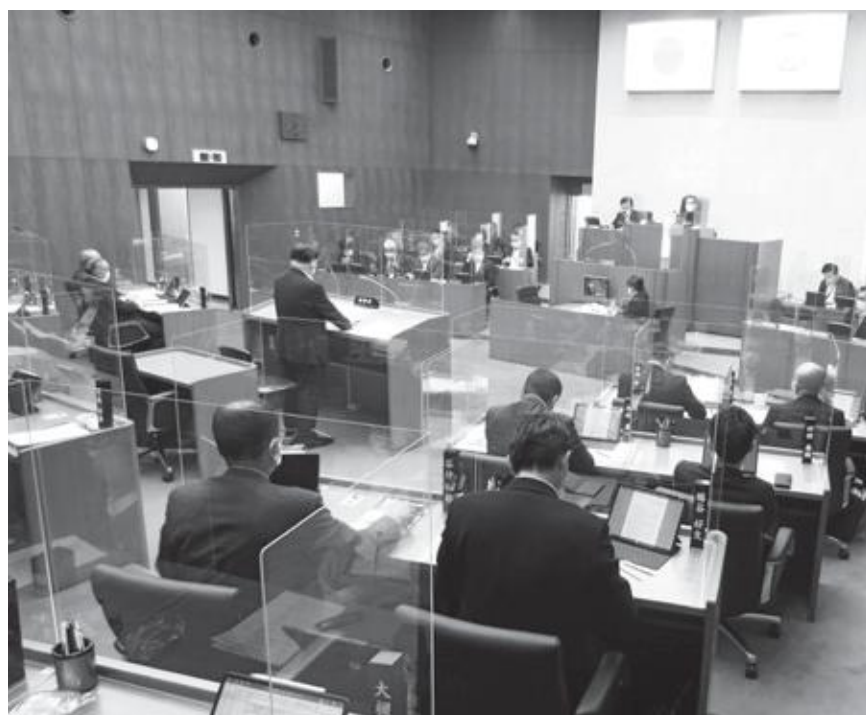
▼ 本会議場（一般質問） ▲

今回の定例会から、議員や執行部に1人1台のタブレット端末を配布し、電子化した議案等を画面で確認できるようペーパーレス化に向けた取組みを開始しました。本会議や委員会などの会議におけるペーパーレス化を図るとともに、ICTを活用した議会運営および議員活動を目指すことを目的としています。