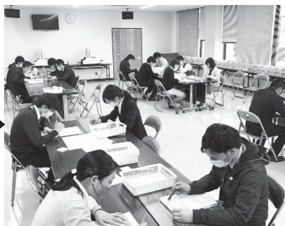
特別定額給付金申請書発送前の確認作業