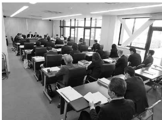
▲文教福祉常任委員会の様子

答 対象者は増えているが、見込人数より申請者数が少なかった。見舞金の支給交付には、市への申請が必要となるが、特定疾患の認定申請窓口は保健所となっているため、市では対象者が把握できず通知ができない。現在は、広報紙へ年5回ほど掲載している。