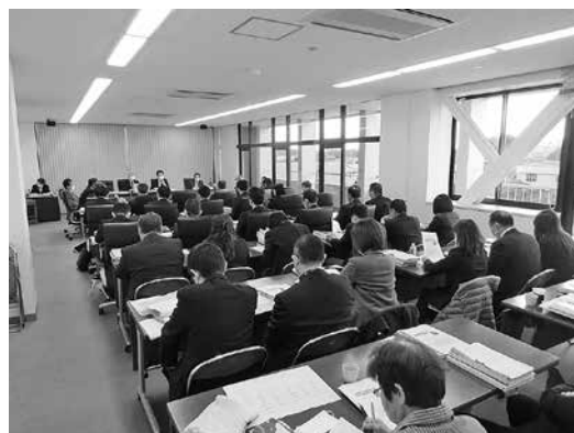
▲総務常任委員会の様子

答 福祉部子ども福祉課は、玉里 総合支所にあつたが、令和2年度 から、教育委員会所管の子ども課 に変わり、小川総合支所2階に配 置する。