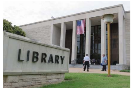
アイゼンハワー図書館