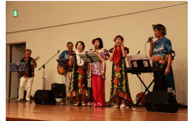
昨年の国際交流ひろばの様子