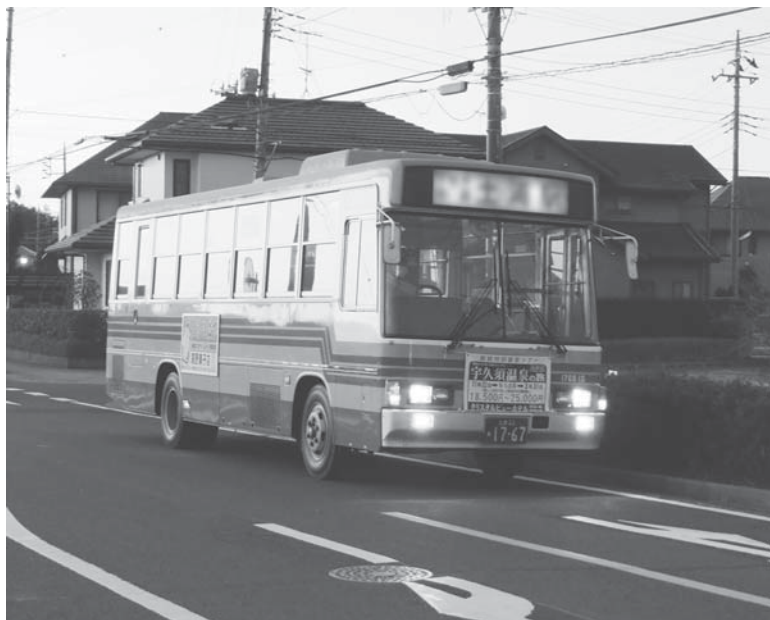
市民の足、公共交通循環バス（イメージ）

設置して決定していく。現状の課題は、運行ルート、バス停留所の位置、運行曜日と時間、運行料金等があるが、同会議での決定を受け、平成25年度中には実証運行を実施する予定。