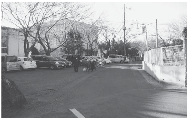
小川小学校正門付近

員会では、石岡警察署や県道及び市道の管理担当部署と連携し、まず、注意喚起を促すスクールゾーンの道路標示や看板設置等ができることから検討し、取り組んでいく。また、ドライバーの交通ルールの徹底やマナー向上に向けた活動に取り組みとともに、各学校でも自転車の乗り方や横断歩道の渡り方などの安全教育の充実を図っていく。