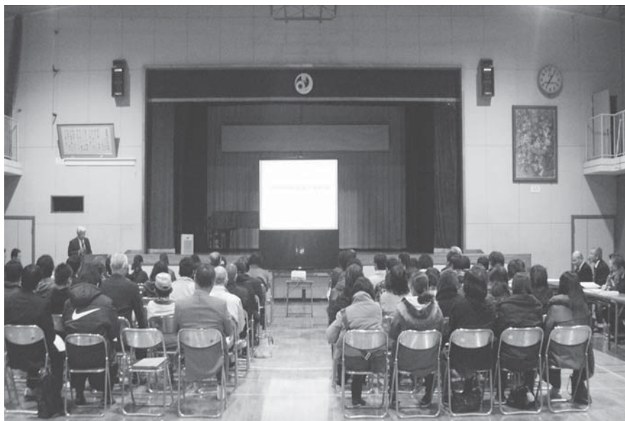
学校適正化の住民説明会（玉里東小学校区会場）

A 教育長 今回の学校適正化基本方針の説明会でいただいた参加者からのご意見を十分に吸い上げ、検討委員会にお諮りし、適正化実施計画の策定を進めていく。