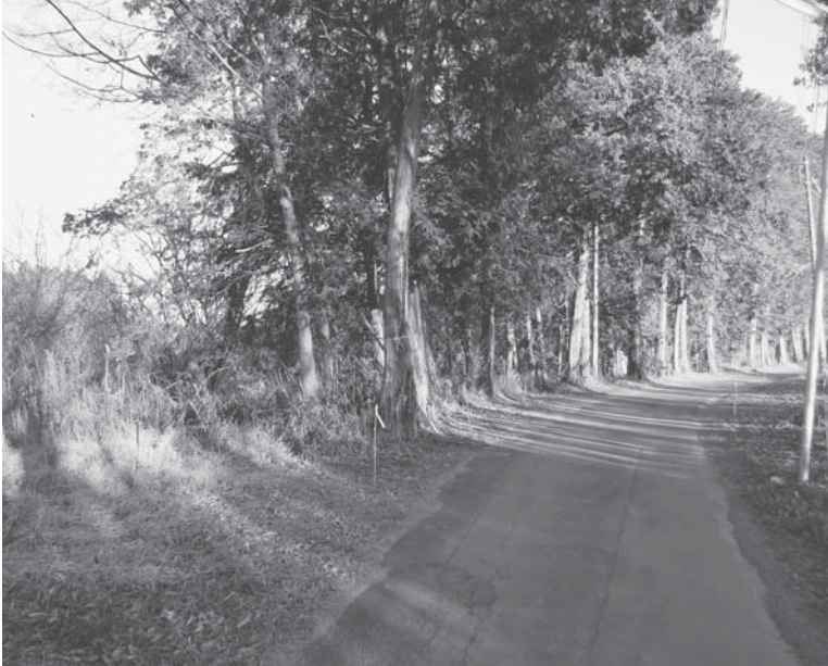
防災公園整備計画が予定される市有地（写真左側） 宮田地内

Q 宮田地区の防災公園整備計画について伺う。①寄付者の目的とこれまでの経緯、②法律上（都市計画法など）の制約はないのかどうか。③防災公園の機能の概要と進入路の計画概要、④防災計画への位置付けと平常時の利用形態は。