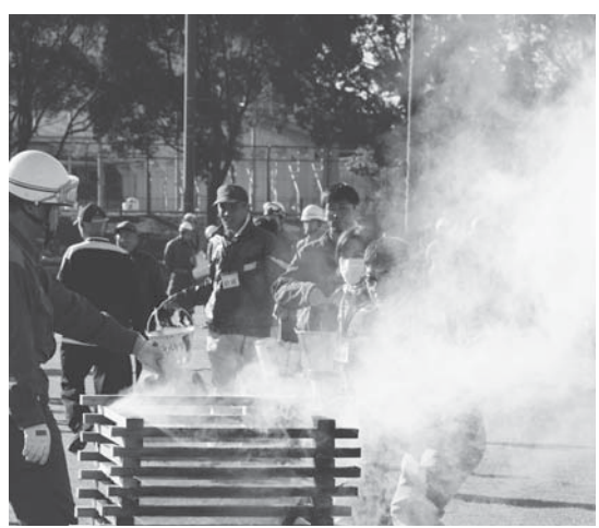
多くの市民が参加して防災訓練 (玉里運動公園)

○ 昨年の東日本大震災の初動体制は十分とはいえなかった。大規模訓練のほかに、地域ごとの防災訓練が大事と考えるので共に実施していただきたい。