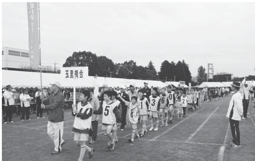
各行政区、各団体による入場行進（市民体育祭）