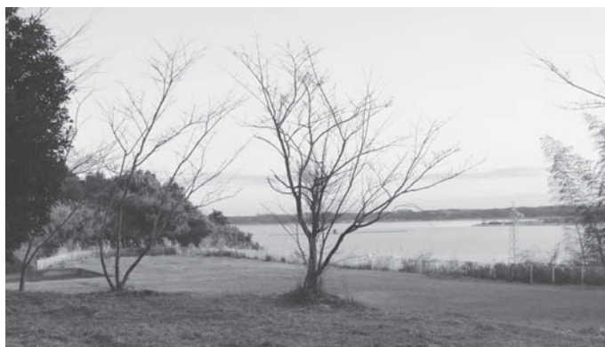
権現山から霞ヶ浦を望む

○広い場所なので、トイレの設置も含め、家族連れや高齢者等が楽に使えるようなバリアフリーに整備していただきたい。 ③権現山から霞ヶ浦を眺める景色は素晴らしい景観であり、特に、夕日を望む景色は心が和み安らぎを持てる風景といえる。若いカップルや家族づれ、また、老若男女を問わず、多くの方に訪れていただきたい場所でもあるので、議員から提案のあった芝桜の植栽など多くの市民の意見を伺いながら整備していきたい。