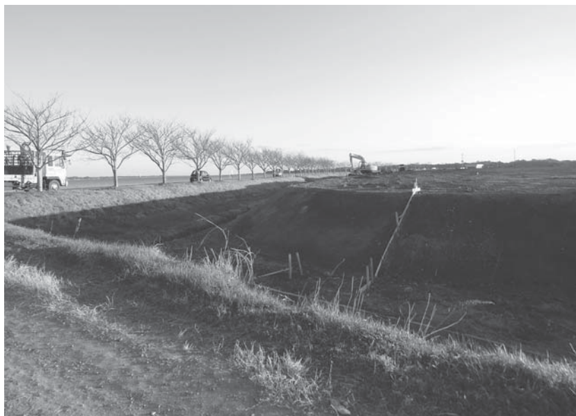
(仮称) 大井戸湖岸公園整備工事に着手

Q 霞ヶ浦沿岸地域交流施設整備計画について伺う。①大井戸湖岸地区整備の進捗状況並びに完成時期は。②「権現山地区整備計画」施設と自然環境に恵まれた地区だが、具体的な内容は。③権現山と霞ヶ浦の景勝は素晴らしい。南側の斜面に芝桜でも植えて、ここに若い人たちが集まるような施設整備をしてみてもどうだろうか。