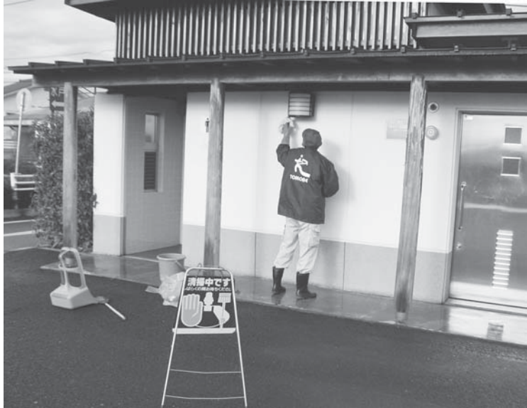
清掃作業に従事するシルバー人材センター登録会員

の会員数は445名となっている。本センターは県内42あるセンターのうち会員数が3位で、事業収益は4位、公共団体や民間企業、一般家庭からの受注と自主事業などで、約4億473万円の実績を上げ、4位となっている。また、就業実人員は886人で、就業率は75・3%という状況である。