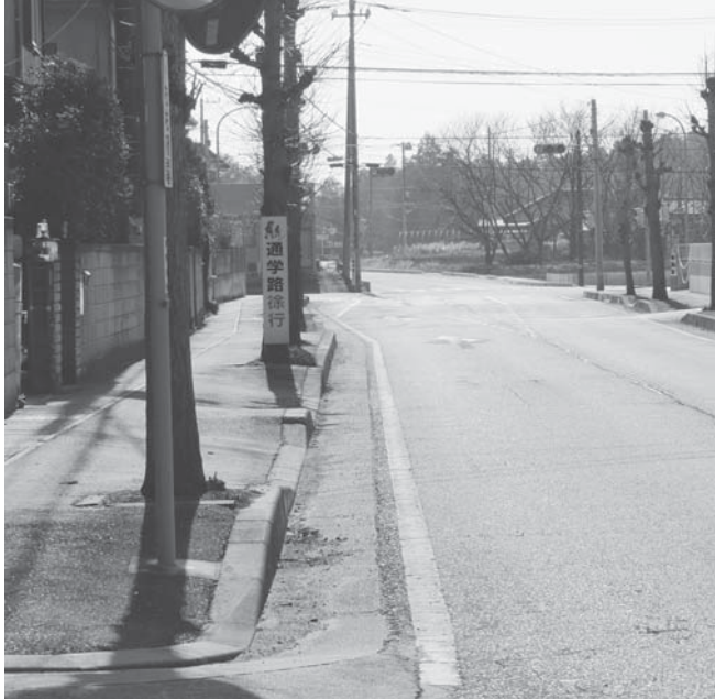
マウントアップ型歩道（脇山地区 イチョウ通り）