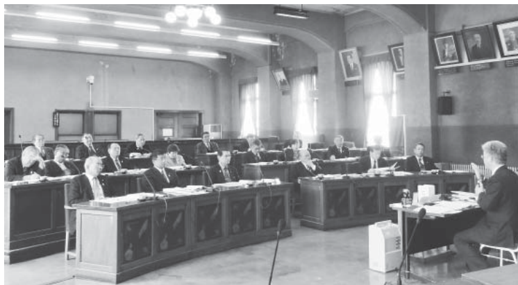
会津若松市議会議場にて

その中で、市民への議会報告会や意見交換会の手法や効果、議会側が政策形成に積極的にかかわっていく「政策形成サイクル」の構築、「議員間討議」、議決責任との関係、常任委員会の運営方法、討議結果のまとめ方、委員長報告の作成などの具体的ノウハウ、議長選挙で