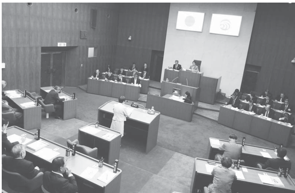
議席（写真手前）の中央最前列に新たに設けられた質問席で、活発な質問が行われた （11日、一般質問初日、傍聴席から撮影）

平成24年第2回定例会は、6月7日から25日までの19日間の会期で開催しました。今定例会では、防災対策諸費などを含む一般会計補正予算を始め、固定資産評価審査委員会委員、公平委員会委員、教育委員会委員などの人事案件などが提案され、市長から提案された議案22件のうち21件を可決（承認・同意）とし、1件を否決としました。また、6月11日、12日には、8人の議員が一般質問に立ち、市政を質 た しました。