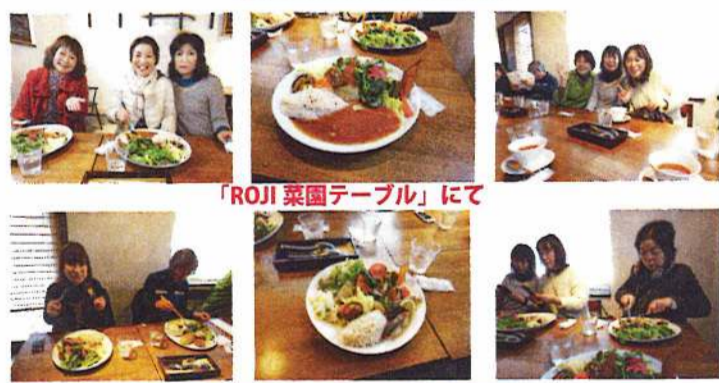
「ROI」菜園テーブルにて