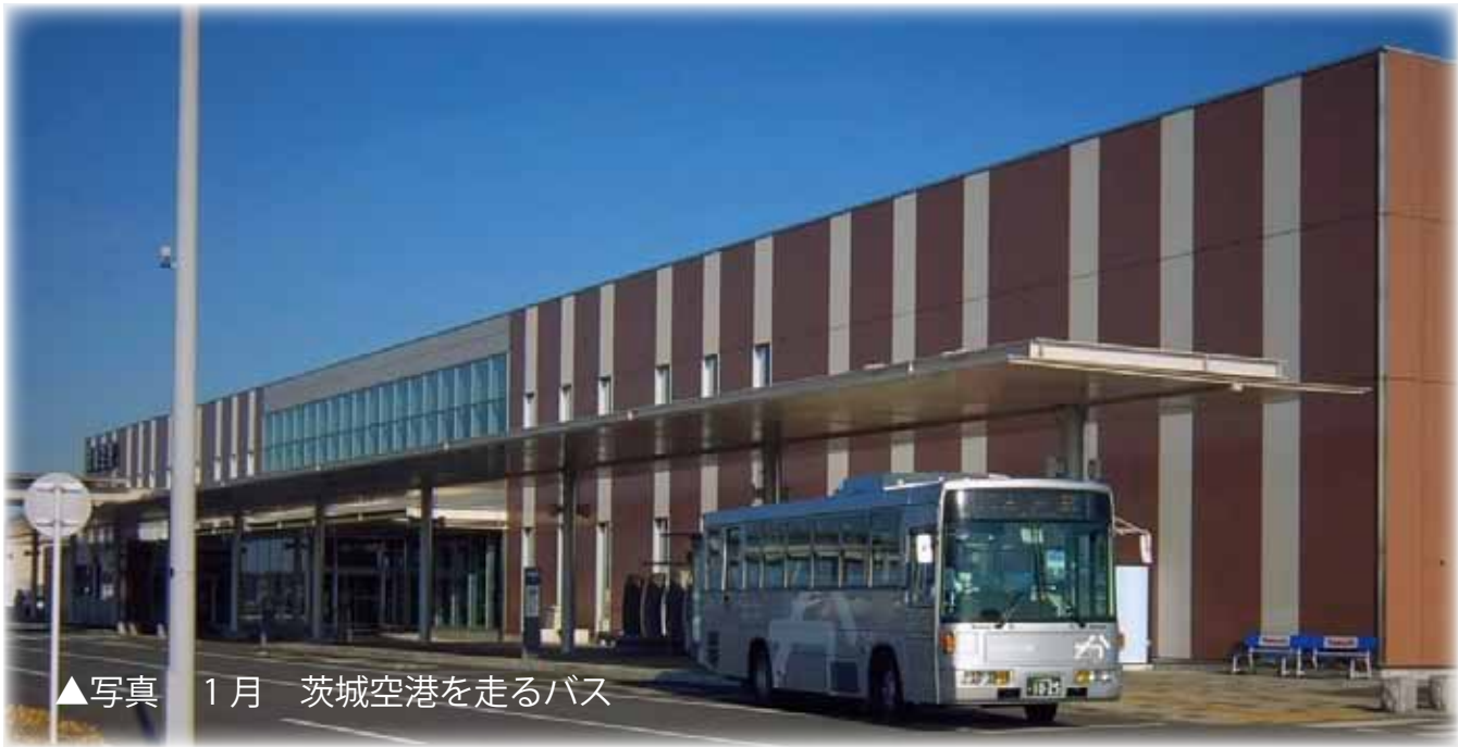
▲写真 1月 茨城空港を走るバス