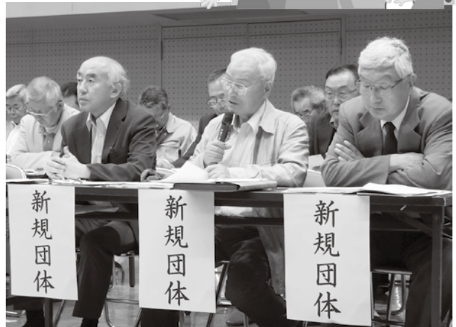
▲ 審査会における申請者による事業説明

去る 5 月 17 日に開催されたまちづくり審査会では、平成 28 年度支援事業前期申請分の審査が行われ、新たに 3 団体がまちづくり組織として認定され、34 団体 50 事業に補助金交付を決定しました。市では、本年度も更なる住民の自治力向上（地域コミュニティの活性化）を目指して、「自分たちの住む地域は、自分たちで良くしていこうという取り組み」を応援していきます。