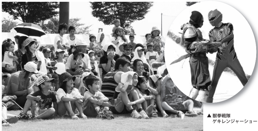
▲散拳戦隊 ゲキレンジャーショー