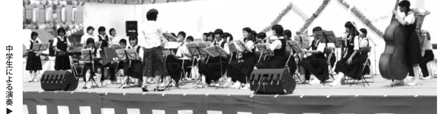
中学生による演奏▶