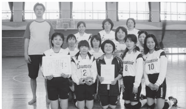
コスモウィンのみなさん