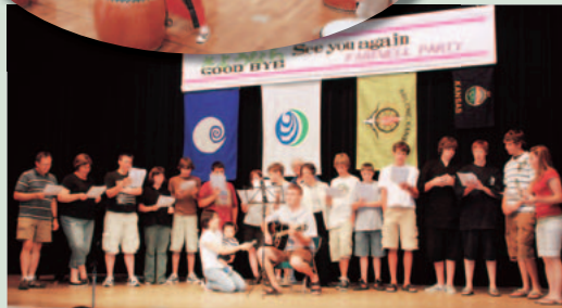
お別れパーティー

7月21日から30日までの10日間、姉妹都市であるアビリン市から17名の訪問団が本市へやってきました。訪問団は市内のご家庭にホームステイし、滞在中はたくさんの方の日本文化に触れ、多くの体験を楽しみました。