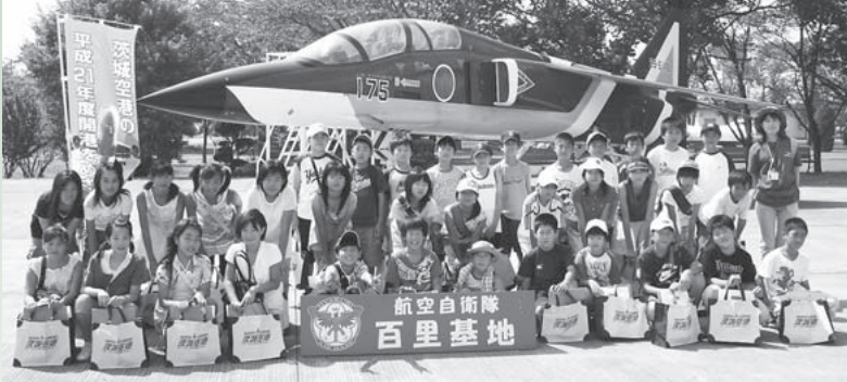
航空自衛隊百里基地にて

見学会では、最初に、航空自衛隊百里基地を訪れ、航空自衛隊の任務や自衛隊機の機能などについて、担当官による説明を受けたのち、間近で自衛隊機の飛行状況などを見学しました。