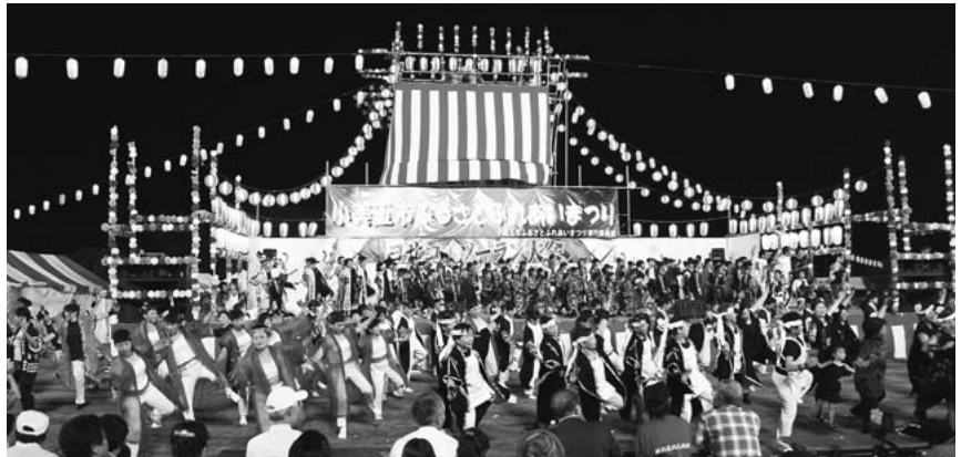
▲前夜祭参加者全員による踊りの披露