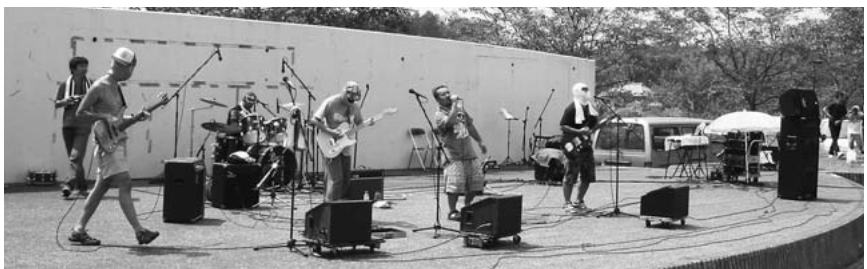
▲ロックフェスティバル