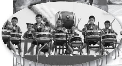
◀園児による創作太鼓