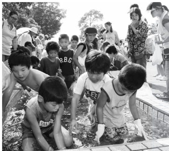
▲うなぎのつかみどり

8月25日、希望ヶ丘公園多目的広場において、「小美玉市ふるさとふれあいまつり」(ふるさとふれあいまつり実行委員会主催)が盛大に開催されました。