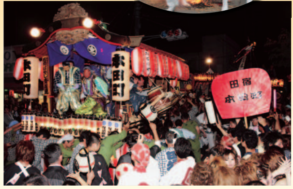
▲小川の祇園(7月20日撮影)