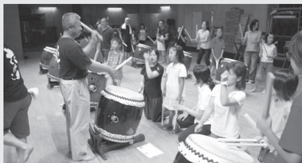
お母さんのほうが気合が入ってます。