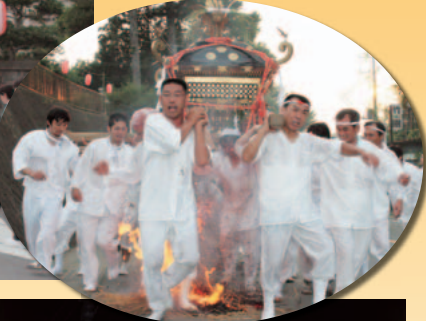
▲竹原アワアワ祇園(7月19日撮影)