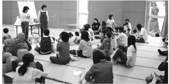
〈読み聞かせボランティア「ひこうせん」による絵本の読み聞かせ〉

普段家の中で過ごすことが多い方や、近くに同じ年頃の子がいないため交流できない方など、ぜひこの機会にご参加ください。