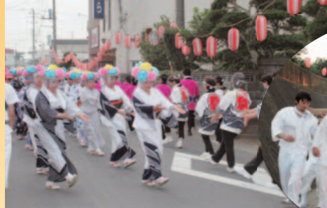
▲羽鳥のまつり (7月27日撮影)