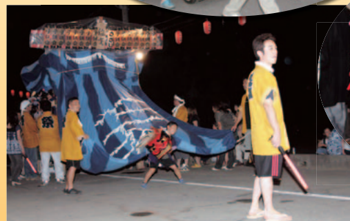
▲佐戈のまつり(7月26日撮影)