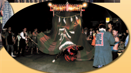
▲堅倉のまつり(8月10日撮影)