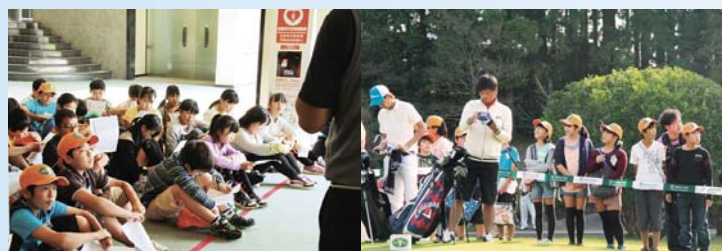
▲説明を聞いている子どもたち ▲間近で見るプロゴルファーに興味津々!