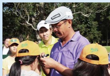
▲サインをもらう子どもたち