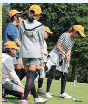
▲わくわく!パッティング体験