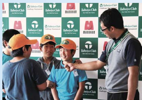
▲今日の感想はどうですか~?