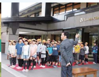
▲クラブハウス内見学