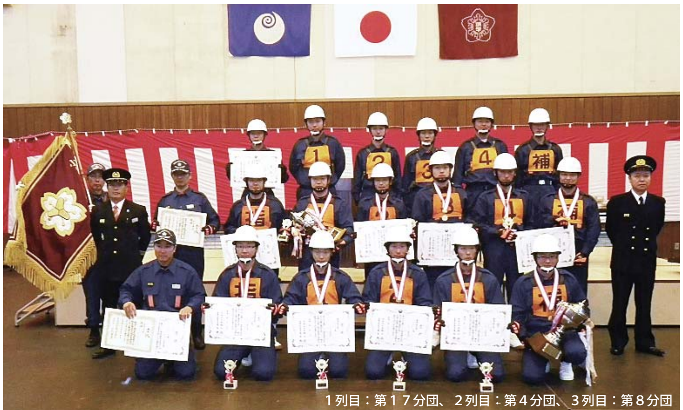
1列目：第17分団、2列目：第4分団、3列目：第8分団