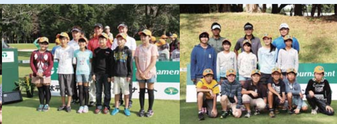
▲プロゴルファーとともに集合写真をパチリ★