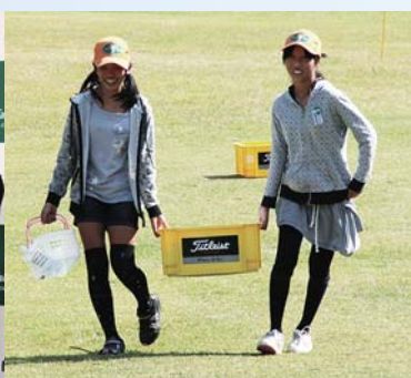
▲みんなでゴルフボール拾い