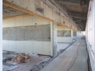
天井・内装解体 普通教室