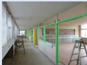
天井・間仕切り設置