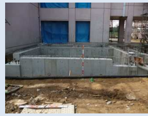
増築予定場所の基礎完成