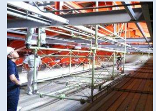
体育館吊り天井調査