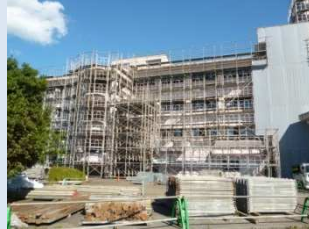
特別教室棟 昇降口側