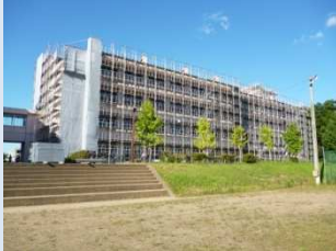
管理教室棟 グラウンド側

工事に本格着手するための調査や現場事務所の設置が行われ、校舎周り全面には足場が組みられました。校舎内部は、エアコン導入のために天井や内装の解体が始まりました。