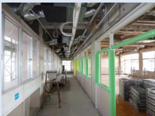
エアコンダクト配管

エアコンダクトの配管が進み、徐々に天井が仕上がってきました。それとともに教室と廊下の間仕切りも新しいものが設置されてきています。また、増築予定場所の基礎が完成しました。