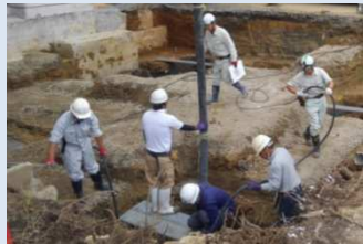
増築予定場所のコンクリート打設