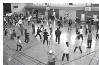
熱戦の3コートバレー

今年、「組織、財政、機材の基盤」を強めて、交流活動をより盛上げて行きたいと思っています。