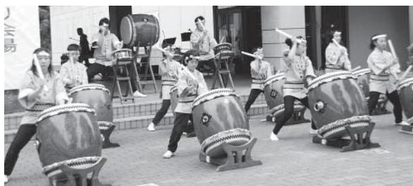
交流まつりで玉里太鼓を披露