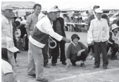
▲H22.10.3 住みよい堅倉地区をつくる会 (第10回みんなで作っまつり)

まちづくり組織の活動 各地でさまざまなイベントを開催し、まちづくり組織が活動しています。