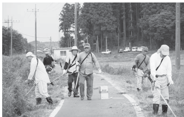
清掃活動に励む組織のみなさん