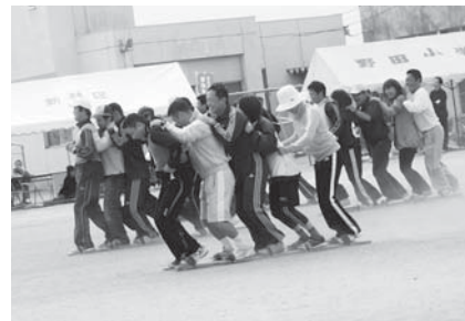
▲H22.10.17 さわやかな野田をつくる会 (第2回健康まつりふれあい運動会)